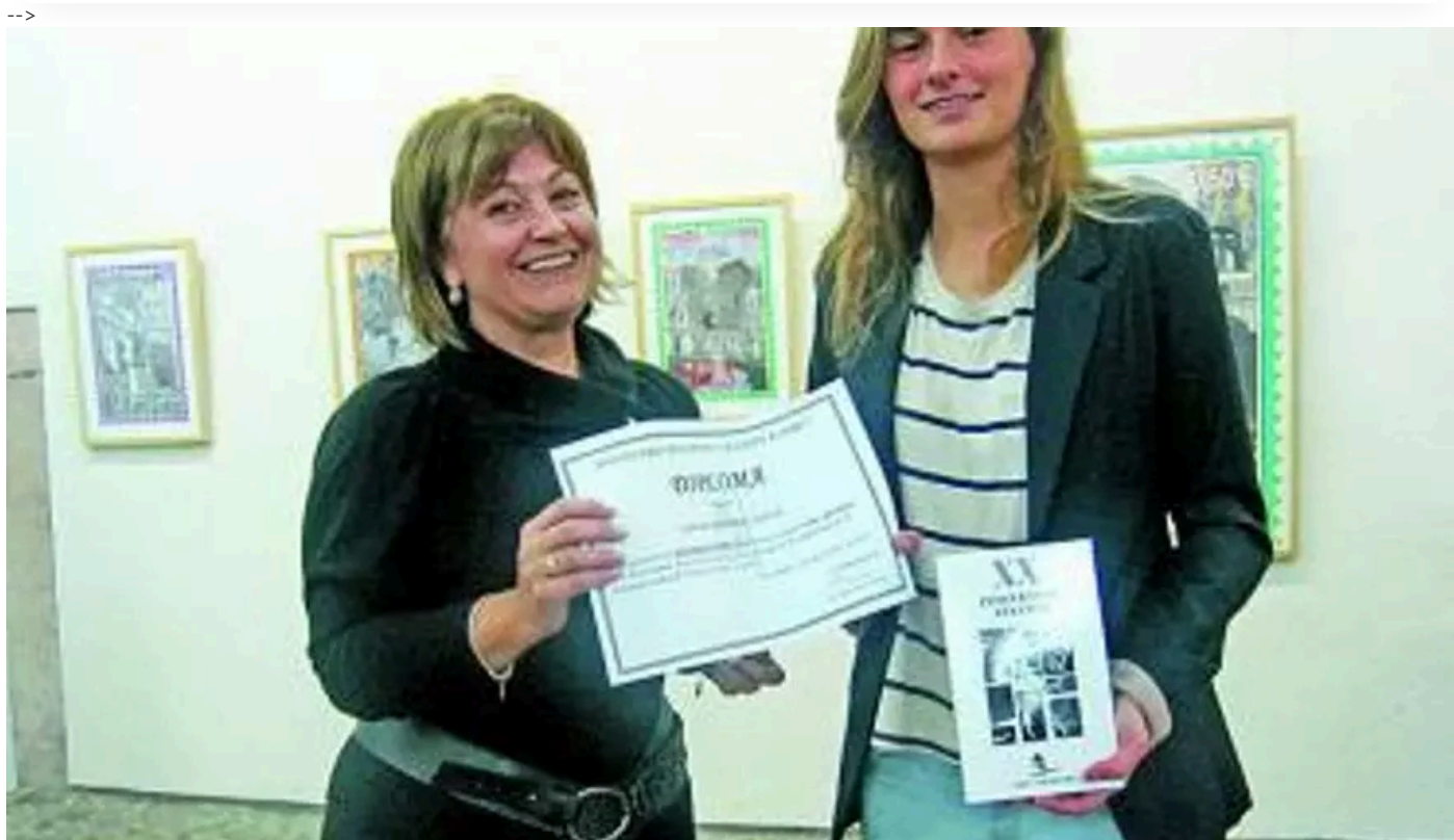
Miranda, cantera de escritores