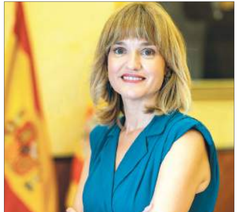
Pilar Alegría, Ministra de Educación y Formación Profesional

Durante el segundo semestre de 2021, el Ministerio de Educación y Formación Profesional, en colaboración con el Ministerio pa-